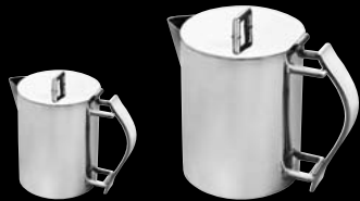
théière tea pot