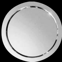
plateau rond round tray