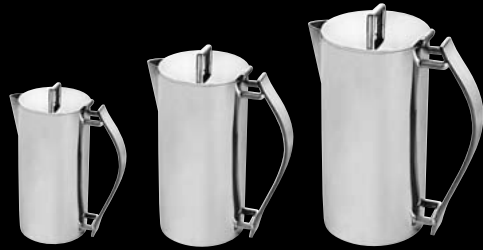
cafetière coffee pot