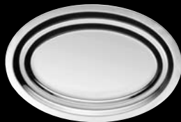
plat à poisson fish dish