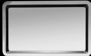
plateau rectangulaire sans anses rectangular serving tray without handles